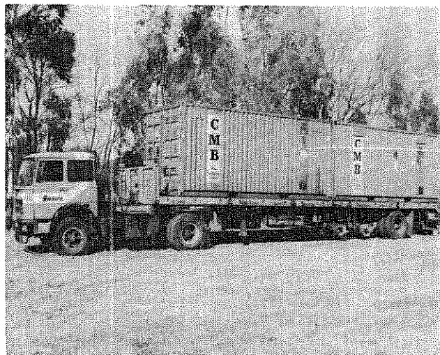
Les containers de la CMB arrivent au campus

Tout l'équipement de la 1 ère phase est arrivé en Argentine en gratuité de transport et franchise douanière. Sa valeur déclarée dépasse les 200.000 U.S.$.