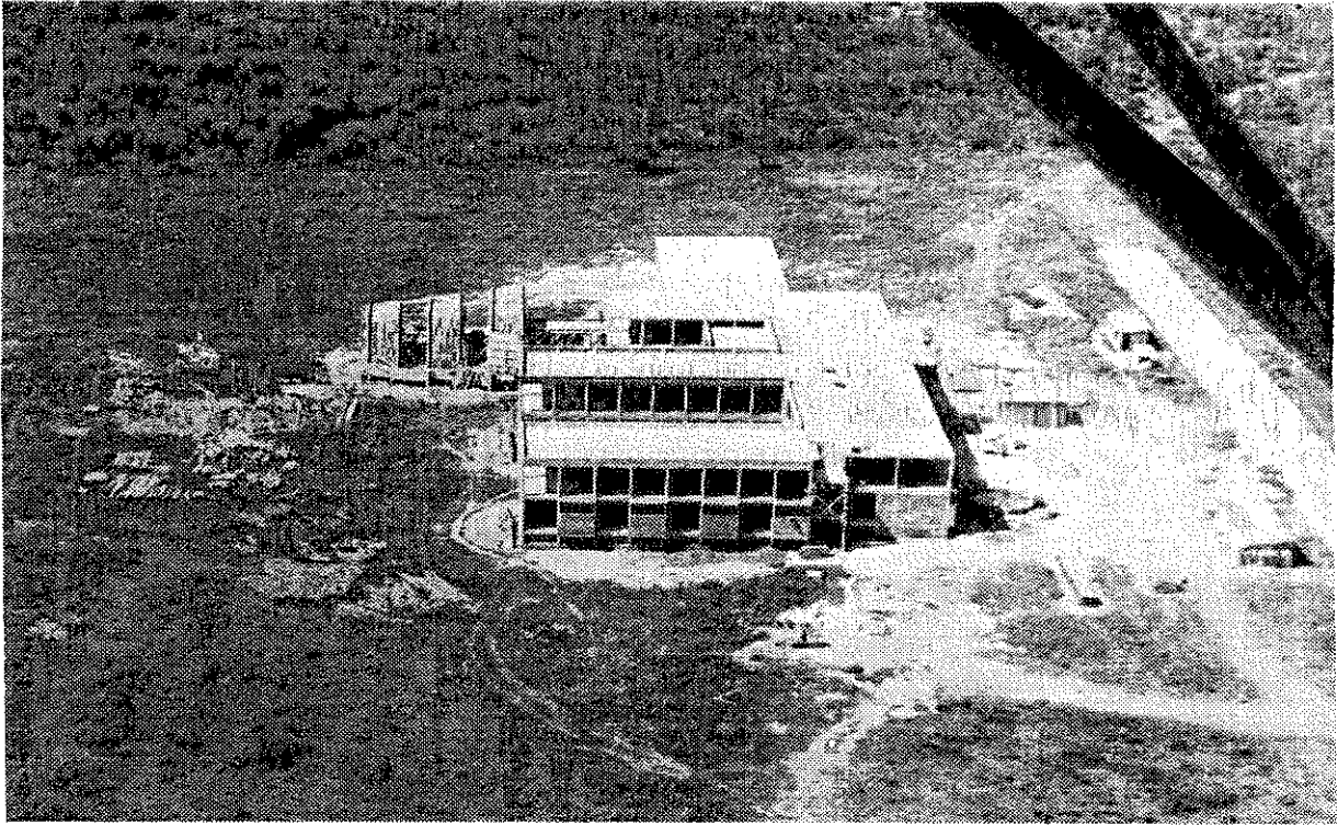
Vue aérienne de la Faculté d'Ingénieurs sur le campus de l'U.C.C., prise en décembre 1965.

locaux en présence des autorités nationales et des représentants de l'ambassade d'Allemagne, pays auquel nous devons une aide si importante pour cette construction.