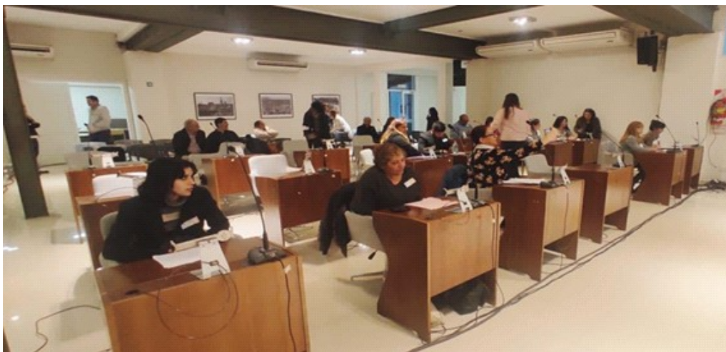
Foto 1. Instancia distrital: estudiantes de la Región Educativa N.º 6 en el Concejo Deliberante de San Fernando

Además de compartir las problemáticas trabajadas en etapas previas, los estudiantes deben formular proyectos (ver Foto 3). Si bien inicialmente estas propuestas fueron concebidas como posibles soluciones que podían impulsar desde su rol y organización, con el tiempo, se han transformado en demandas dirigidas al Estado. Un ejemplo de ello es la Declaración Parlamentaria Provincial del año 2023 (BAeducación, 2023), en el eje de Participación Ciudadana y Derechos Humanos, donde propusieron lo siguiente: