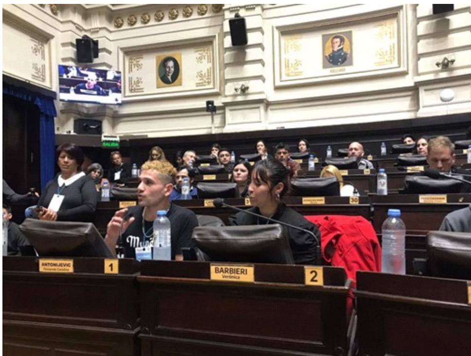
Foto 4. Instancia nacional: estudiantes de distintas provincias leyendo la Declaración Parlamentaria en el Congreso de la Nación Argentina

Por un lado, se ofreció a los estudiantes la posibilidad de investigar, a partir de los ejes propuestos y de la guía del docente, sobre problemáticas vinculadas con la realidad de sus territorios. Por otro, se habilitó un espacio de encuentro e intercambio entre estudiantes de distintos centros, distritos e, incluso, provincias, lo que les permitió conocer realidades diversas pero, a la vez, similares a las propias. Finalmente, se brindó la oportunidad de "poner en acto" la participación ciudadana mediante el debate de propuestas y la votación entre estudiantes para elegir representantes en todas las instancias del programa.