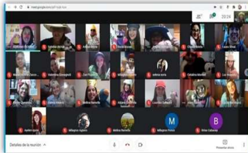
Imagen 3: Capturas de pantalla de la clase del Proyecto de articulación: Nos encontramos jugando. Unidad curricular: Psicología y Educación del Primer Año del Profesorado de Educación Inicial. Años lectivos 2020 y 2021