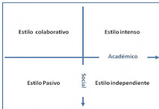
Figura 2: Estilos de compromiso académico

Finalmente, el estilo independiente , es propio de los alumnos que tienen una participación fuerte e individualista con el estudio, lo que coincide con una visión positiva de los miembros que inte-