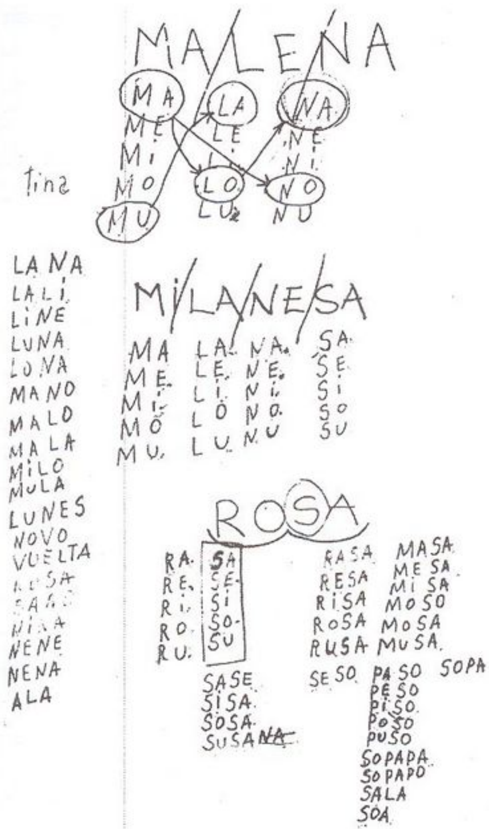
Gráfico 1-A: Alfabetización de adulto