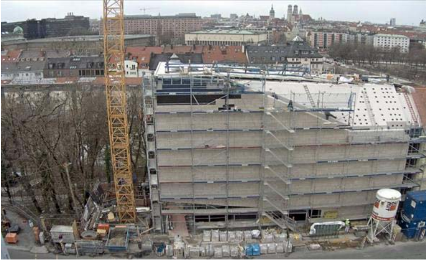
Webcam Baustelle Sudetendeutsches Museum (2018): http://baudoku.1000eyes.de/cam/probat/ACCC8E297DAC/

y son sus hijos y sus nietos los únicos que pueden mantener viva esa memoria. Se han recopilado miles de documentos, objetos y recuerdos. El museo, aunque ha recibido fondos estatales, ha sido posible gracias a donaciones privadas.