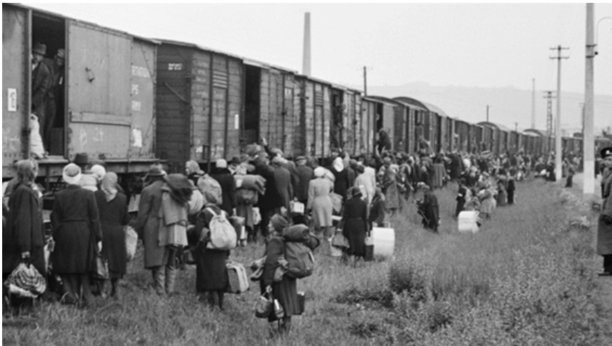
(dpa / CTK), 2016

de agosto de 1945: “Traslado ordenado de las partes de la población alemana”. Los aliados consiguieron llegar a un acuerdo con los gobiernos de Hungría, Checoslovaquia y Polonia en relación a la expulsión de los Sudetes, que debía hacerse de forma “ordenada” y “humana” y no antes de que el Consejo Aliado de Control hubiese evaluado la situación y registrado el número de personas. Por medio de este documento se legaliza la situación de las expulsiones de los alemanes a partir de agosto de 1945, pero la expulsión y huida de la población, denominadas expulsiones salvajes o “ wilde Vertreibungen ”, ya habían tenido lugar mucho antes con la llegada de las tropas soviéticas entre enero y julio de ese mismo año . Se estima que más de 30.000 Sudetes tuvieron una muerte violenta durante este proceso. Otros sufrieron deportaciones masivas a la Unión Soviética desde Polonia, Ucrania, Besarabia, países Bálticos, Yugoslavia o Austria principalmente. En Checoslovaquia el gobierno de Benes ya había forzado la salida de casi un millón de Sudetes alemanes entre mayo y junio de 1945, sin la autorización de los aliados. Sólo en Eslovaquia la expulsión fue más ordenada y humana. Los expulsados recibieron dinero y pudieron llevarse hasta 100 kilos de equipaje por persona. En la fotografía podemos ver uno de esos trenes que se encargaría de llevar a los Sudetes expulsados a la frontera con Alemania.