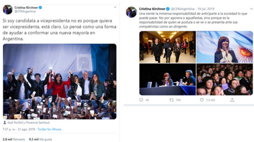
Imagen 1. Ejemplo de componente personal-político