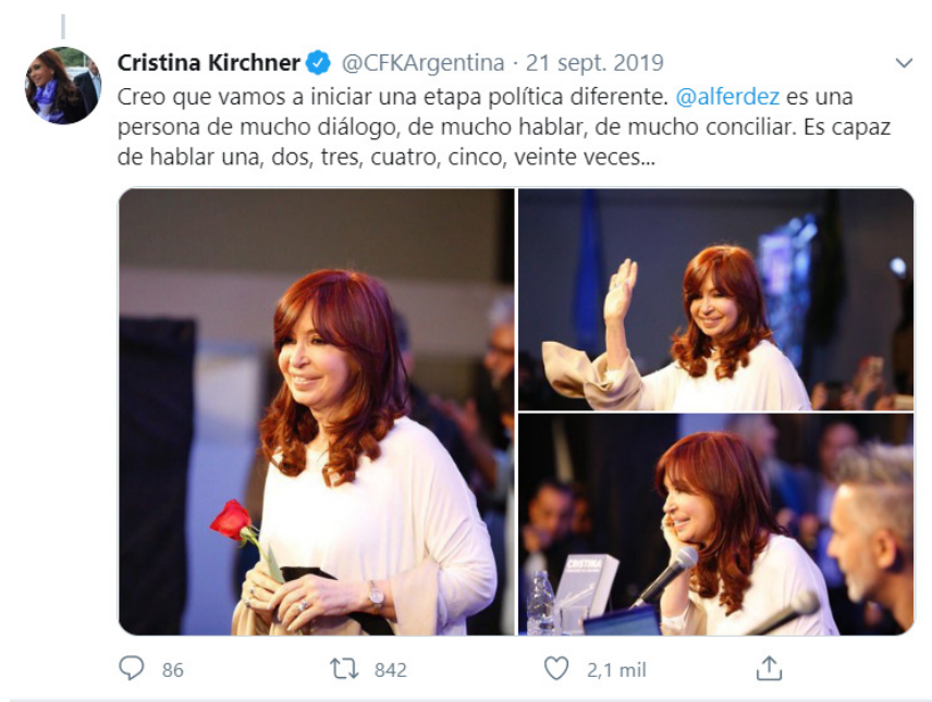
Imagen 4. Ejemplo componente político-electoral

que hizo alusión se encontraba su candidato a presidente, Alberto Fernández. Uno de los mayores capitales políticos sobre los que se hizo hincapié fue la participación de Fernández como jefe de gabinete del gobierno de Néstor Kirchner en 2003 (particularmente en referencia a la reestructuración de la deuda externa y el proceso de reconstrucción económico posterior). Además, en varias ocasiones se destacó su capacidad de diálogo y formación de consensos, indispensable para el nuevo espacio político y la etapa que se avecinaba.