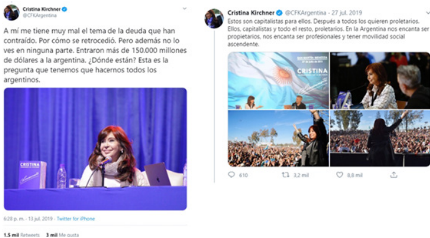
Imagen 5. Ejemplo de diagnóstico económico-social.