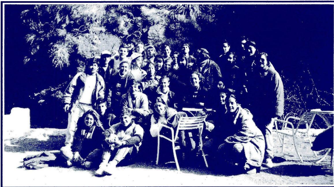
El Campamento CUCCOR al pie del Cerro Uritorco.