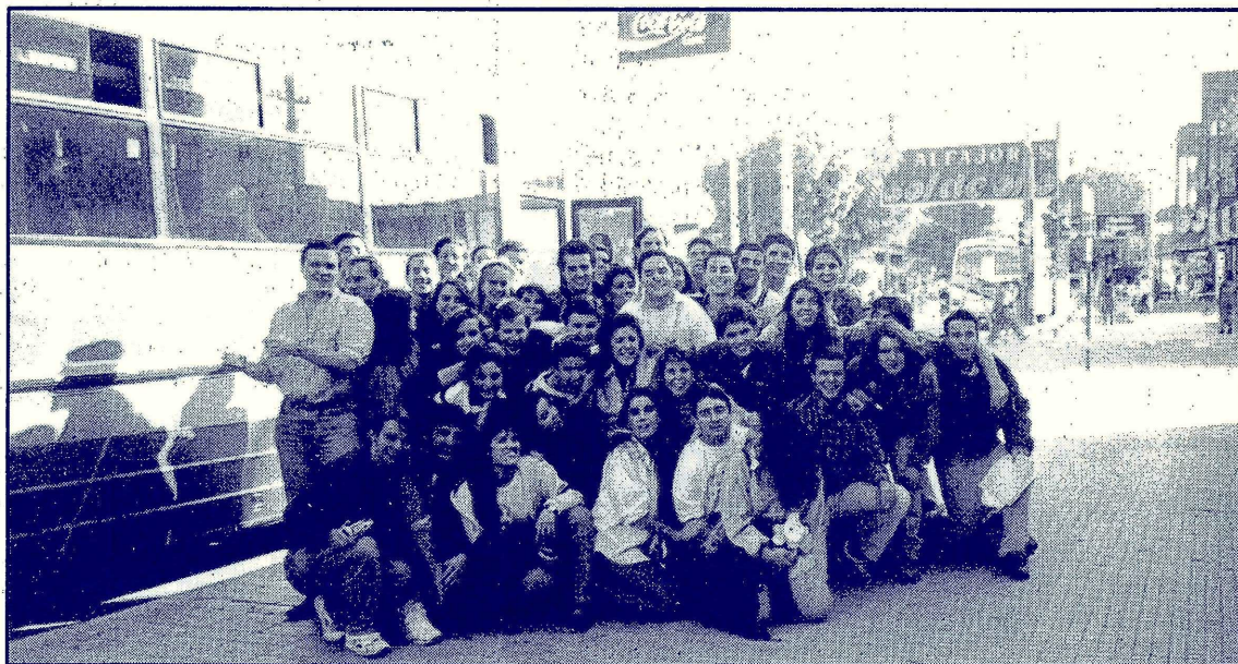
Grupo de AELADE rumbo a las Termas

Durante los días 12, 13 y 14 de Junio se realizaron en la provincia de Sgo. del Estero las 3ras. Jornadas Taller de Innovación Empresarial para Universitarios; las 1ras Jornadas habían sido realizadas en la localidad de Carlos Paz en el año 1991, organizadas por AELADE de nuestra Universidad, y las 2das. Jornadas en el año 1992 organizadas por la Universidad de La Plata.