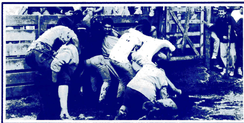
Ingenieros Agrónomos dedicados a la madre tierra.

De todas las fiestas de bienvenida de nuestra Universidad, una de las más famosas y ruidosas es la que lleva a cabo la Facultad de Agronomía, y como no podía ser de otra forma, este año volvió a colmar las expectativas creadas en torno a ella.