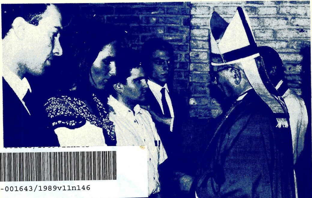
El Cardenal Primatesta confirma a alumnos en la capilla del Campus.

La ceremonia se realizó en compañía de familiares, amigos y compañeros, y al finalizar se los agasajó con un pequeño refrigerio en el Vicerectorado de Formación.