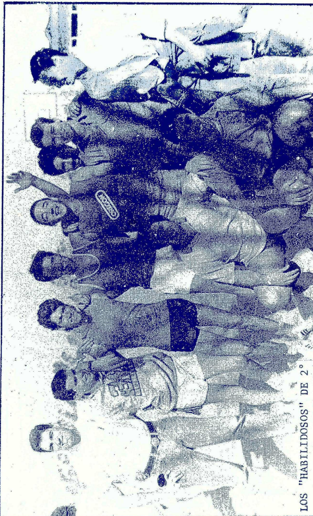
LOS "HABILIDOSOS" DE 2°

Los Torneos realizados hasta la fecha son: