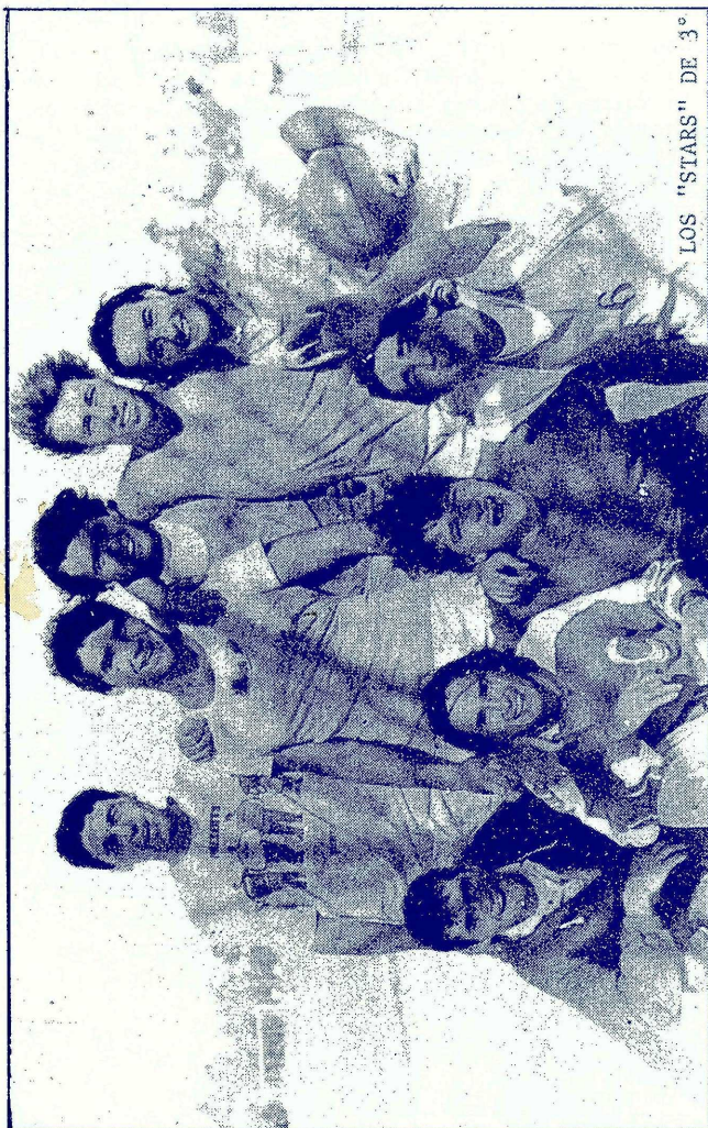
LOS "STARS" DE 3°