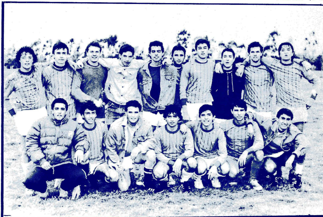
CIENCIAS ECONOMICAS II, VENCEDORES. ...POR AHORA.