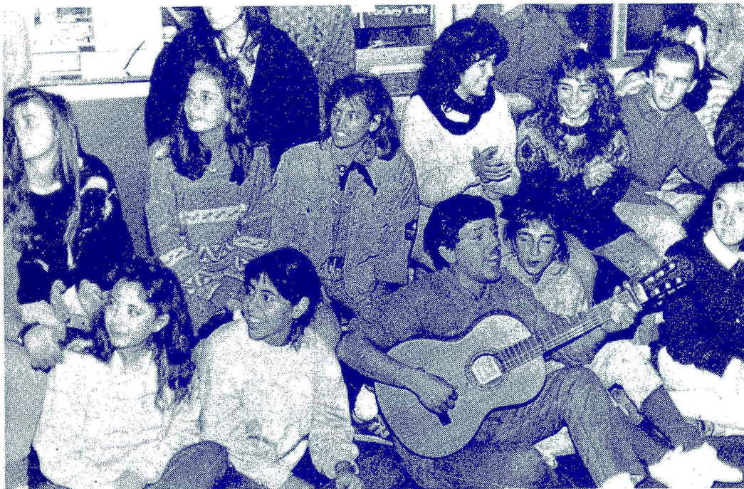
UNA DE LAS DOS GUITARRAS QUE ANIMARON LA FIESTA, RODEADA POR LAS "QUIMICAS"

El pasado 6 de Mayo los químicos recibieron a los nuevos ingresantes con una alegre fiesta en el bar de Cs. Económicas. Los de 1° se hicieron esperar, pero mientras tanto una guitarra da a dúo generó una improvisación de bailes típicos de cada provincia: chamamés, carnavaletos, cuartetazos, etc.