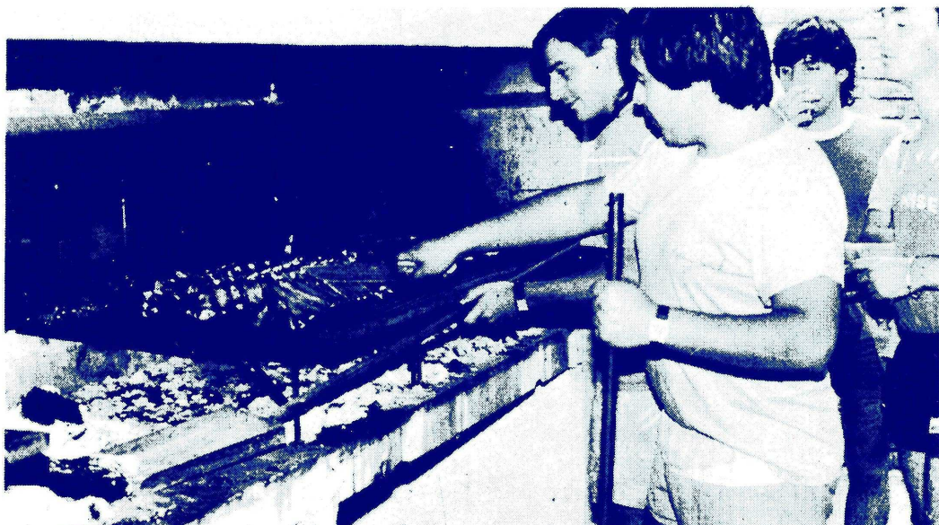
EL SECTOR MAS CODICIADO, LA PARRILLA ... A LA DERECHA SUS GUARDAESPALDAS

¡¡¡ Que se repitan todos los meses !!! ¿la causa? ... después la ponemos.