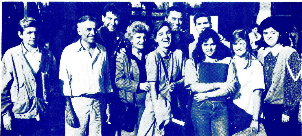
EL CORO SE DIVIERTE...EN EL CAMPUS.

El objetivo de la gira fue incitar, provocar, o estimular a nuestro estudiantado de que cantar en el coro puede ser una experiencia interesante.