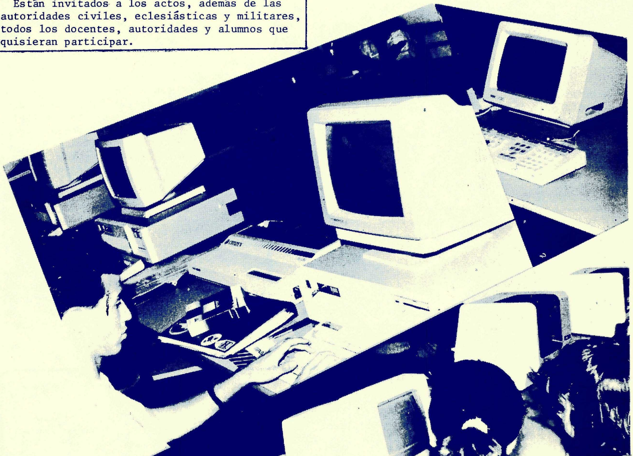
UNAS IMAGENES DEL CENTRO DE COMPUTOS UBICADO EN LA FACULTAD DE INGENIERIA