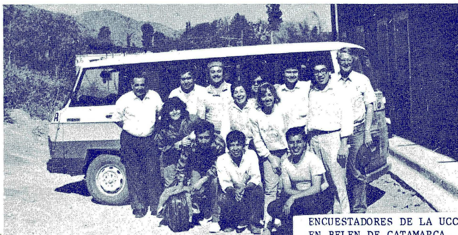
ENCUESTADORES DE LA UCC Y DE LA UNCAT EN BELEN DE CATAMARCA.