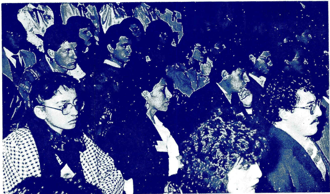
ATENTOS PARTICIPANTES DEL CONGRESO.