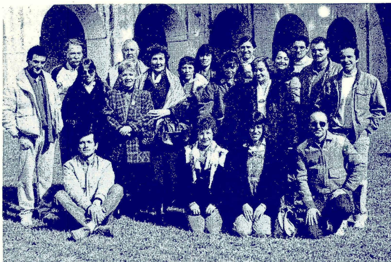
PROFESORES Y ESTUDIANTES DE LA FACULTAD DE FILOSOFIA Y HUMANIDADES EN EL MUSEO JESUITICO DE JESUS MARIA