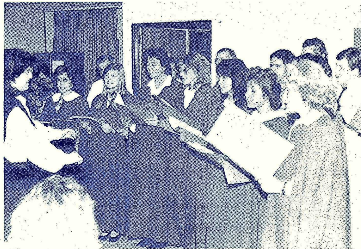
BRILLANTE ESTRENO DEL CORO EN LA INAGURACION DEL CENTRO REDUC