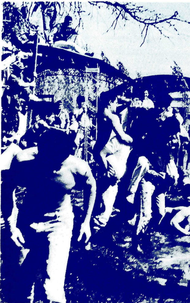
JUQUEMOS EN EL BARRO ...

Cabe acotar que el éxito gastronómico se debió