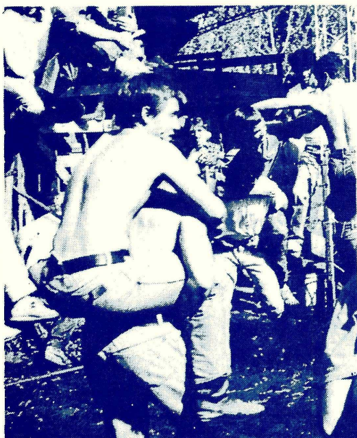
HIPISMO EN EL LODO