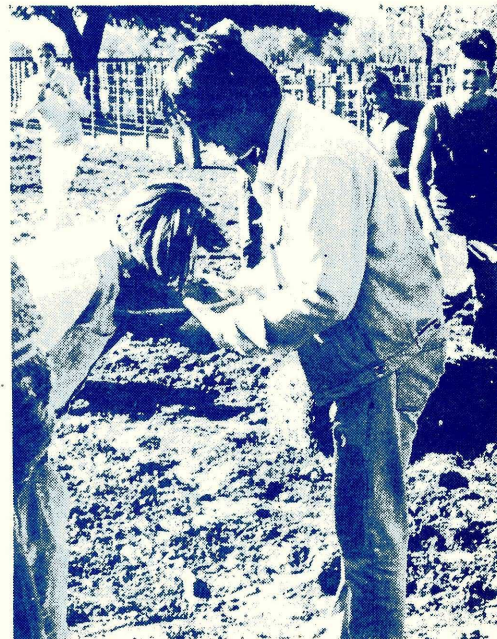
CARRERA DE EMBOLSADOS