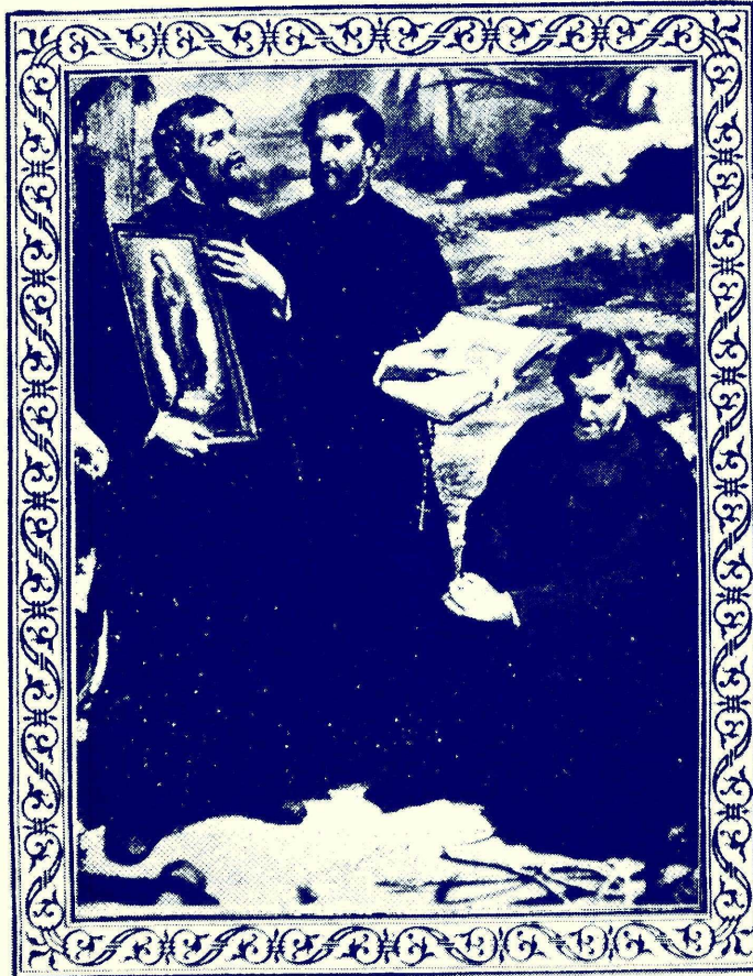
ANTIGUA IMAGEN DE LOS BEATOS MARTIRES RIOPLATENSES, ROQUE GONZALEZ, ALONSO RODRIGUEZ Y JUAN DEL CASTILLO.