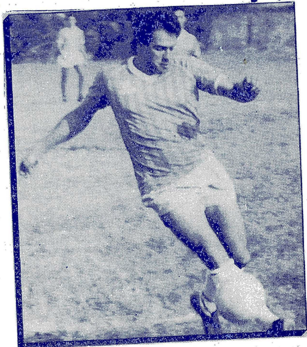
PELIGRA EL ARCO DE AGRONOMIA B