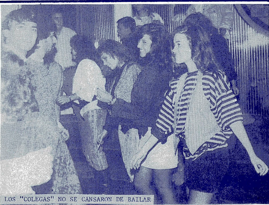
LOS "COLEGAS" NO SE GANSARON DE BAILLAR

Organizado por la Secretaría de Deportes y Recreación de Derecho, el sábado 15 se llevó a cabo la fiesta de bienvenida a los alumnos de 1° año de esa facultad. La fiesta fue en la boite Black Point, camino a villa Allende, y contó con la presencia de aproximadamente 500 personas. ¡Todo un éxito! El Centro de Estudiantes organizó también una rifa de tres estadías en Bariloche, pero el equipo de NOTICIAS UCC no logró individualizar los ganadores. Sabemos que Derecho tiene pensado organizar otra fiesta a lo largo de este año y esperamos que tenga el mismo éxito que tuvo esta.