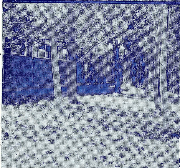
CAMINAR ENTRE LAS HOJAS SECAS. UNA PEQUEÑA DELICIA DEL OTOÑO EN EL CAMPUS.