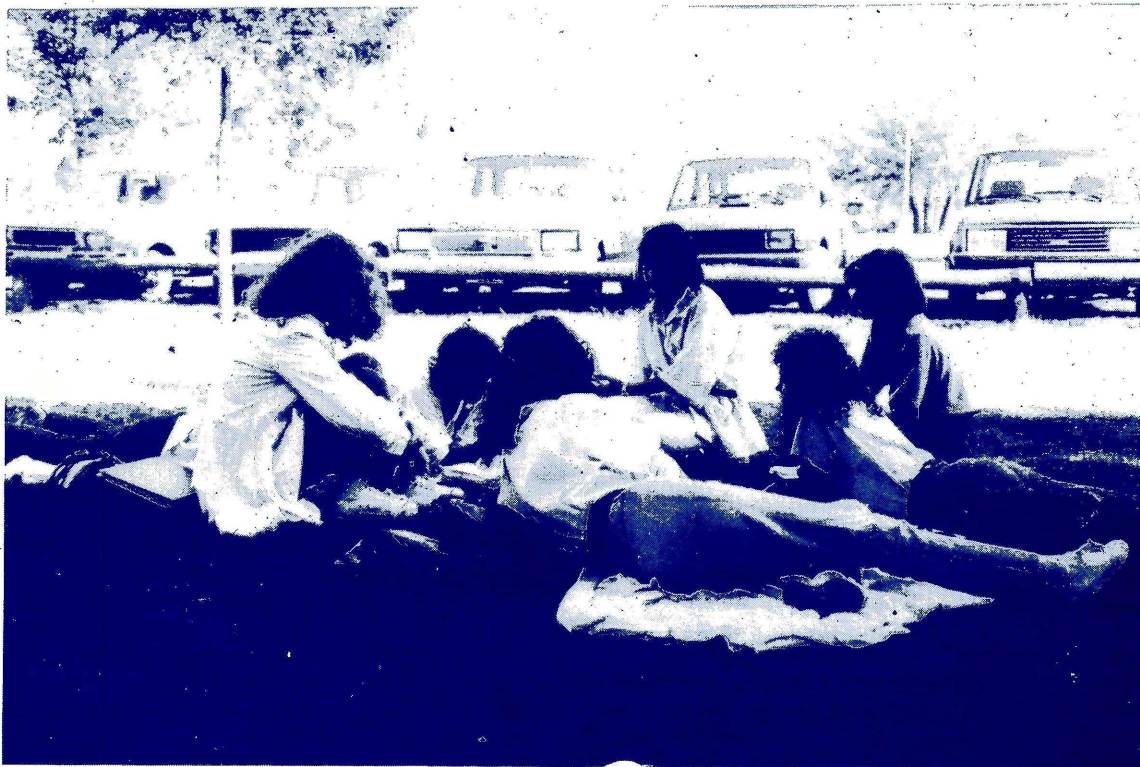
LOS CALORES ESTIVALES Y EL PERFUMADO CESPED DEL CAMPUS