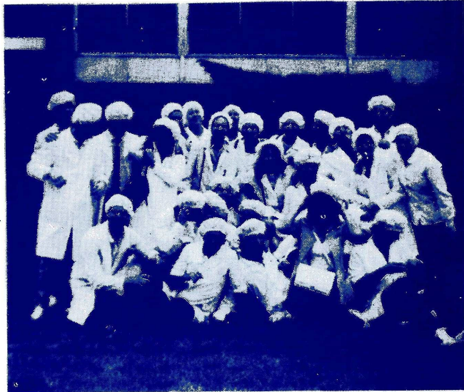
LOS Y LAS MONSTRUOS QUIMICOS CON SUS COFIAS...

P/D: Requisitos para ser "Monstruo/a" : poseer un guardapolvo, una "cofia estéril" y dormir solamente en colectivos en movimiento.