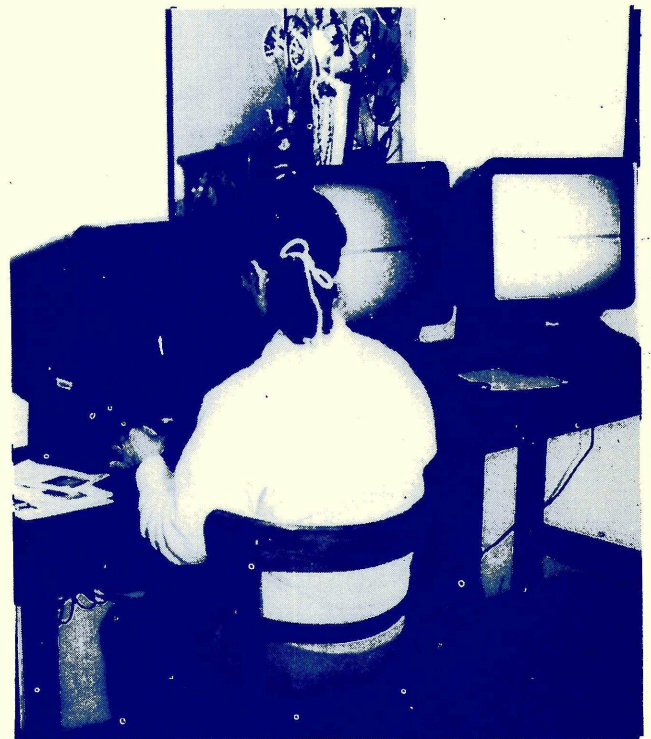
Los Lectores de Microfichas son usadas en la Facultad de Filosofía y Humanidades.

Existen otras muchas redes de información que funcionan de distintas maneras. Hoy en día constituyen las bases indispensables de la actividad científica.