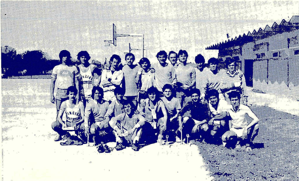
GANADORES DEL TORNEO INTEGRAL 1983: CS. ECONOMICAS