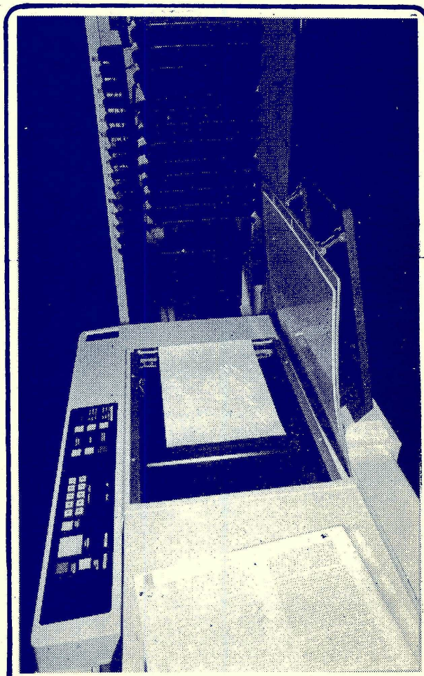
VISTA DE UNA DE LAS NUEVAS FOTOCOPIADORAS CON ... EN EL CAMPUS