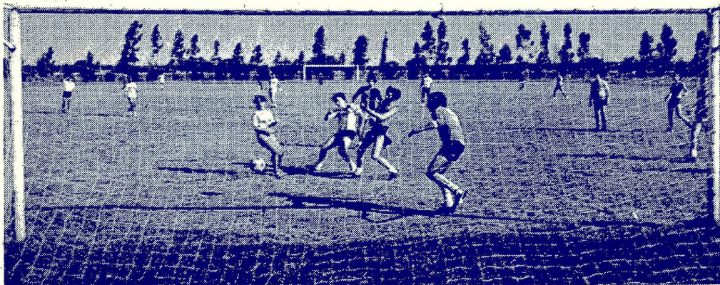
GOL DE PERIODISMO CONTRA CIENCIA POLITICA