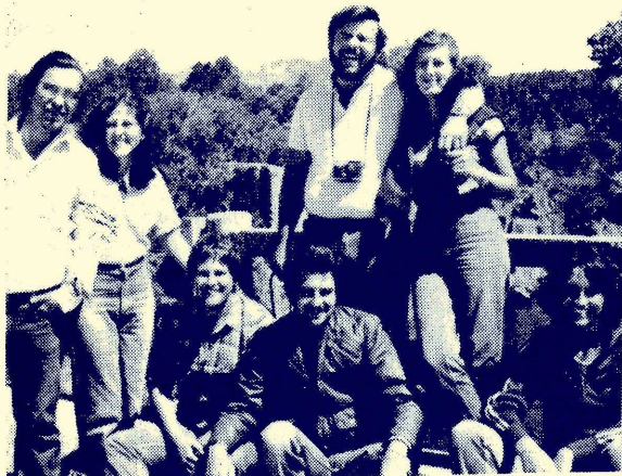
LOS SIETE MISIONEROS DEL CHUBUT

El 2 de enero partíamos en dos coches hacia el Chubut. Eramos siete, nadie comocía el camino para llegar vía Trelew a Corcovado, en donde desde hace dos años el grupo misionero ha establecido su campo de acción.