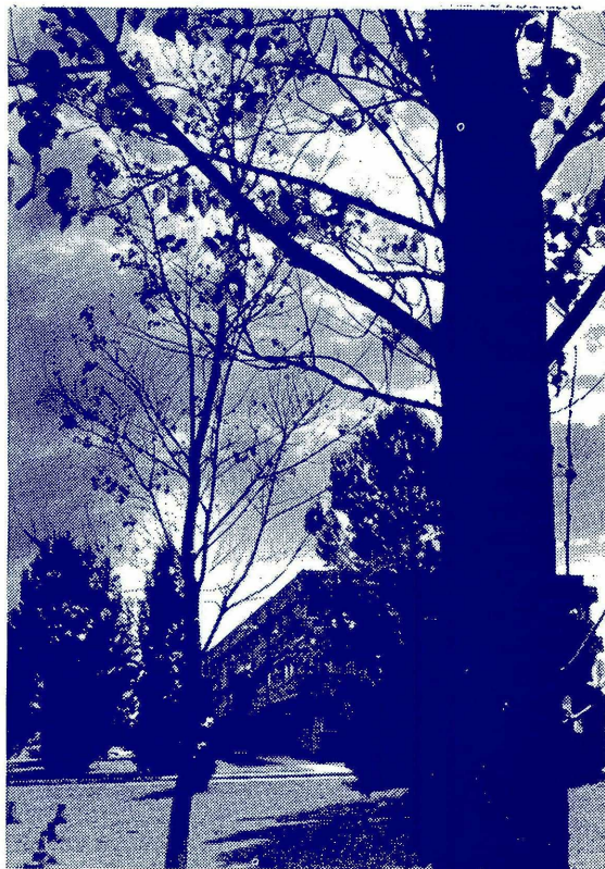
PRIMAVERA EN EL CAMPUS

Con motivo del viaje, que se realizará a avión de la Fuerza Aérea, se presentará también un concierto en la vecina ciudad de Rawson. Buen viaje y buena suerte!!