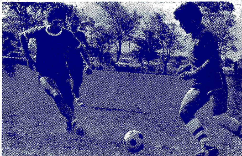
GALENOS vs. LABORATORIO

Se encuentran muy avanzadas las obras del nuevo playón que contará con canchas de voleibol, basquetbol y handbol, lo que permitirá la realización de los futuros torneos de esos deportes en el Campus facilitando así la participación de mayor número de alumnos.