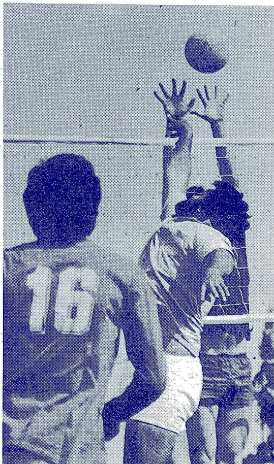
ARDUO PARTIDO DE VOLEY EN EL CAMPUS

También, este fin de semana contaremos con el servicio de bar, en el nuevo Salón Multiuso, mientras se desarrolle el torneo estudiantil interuniversitario denominado "amistad".