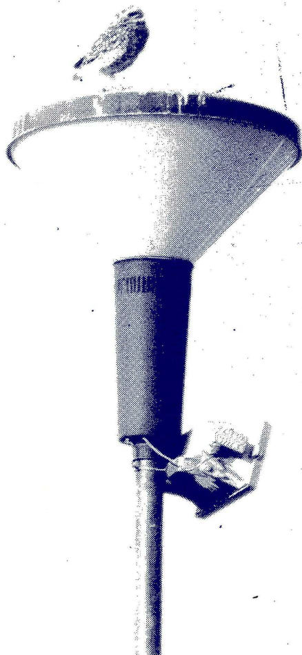
EL EXPECTANTE BUHO

Desde hace ya mucho tiempo, el buho es el pájaro que simboliza la sabiduría. Desde hace un tiempo, también, el campus es el hogar del símbolo viviente que mora en las cercanías de la Facultad de Arquitectura. Vaya sabio!