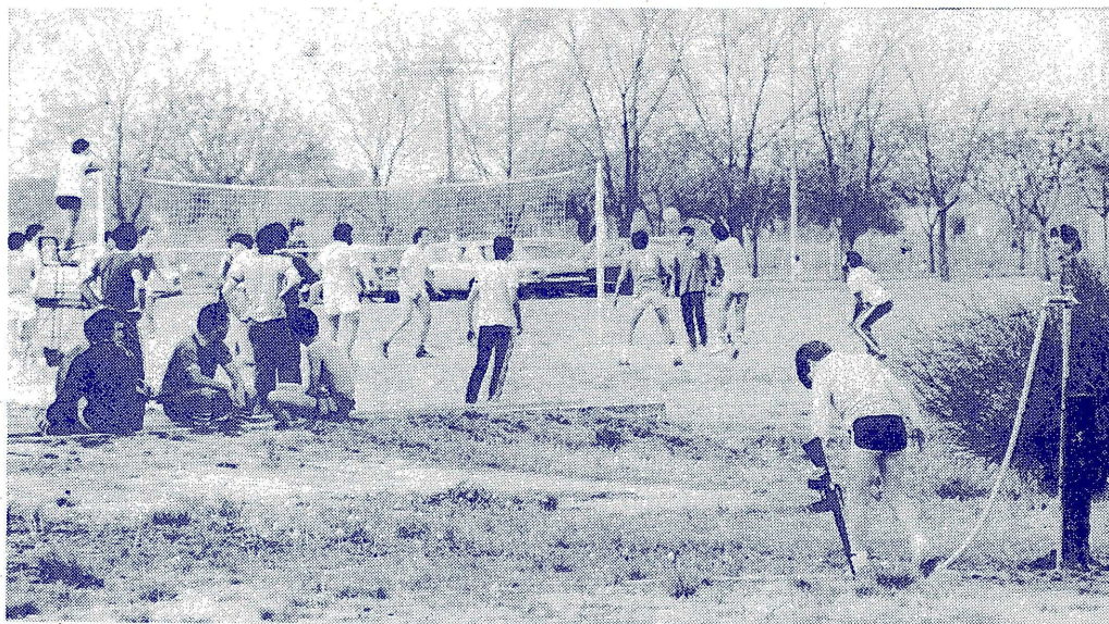
VISTA PARCIAL DEL CONCURRIDO CAMPO DE DEPORTES