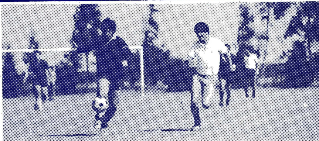
DISPUTA DEL 3º PUESTO ENTRE AGRONOMIA Y DERECHO.

Se aprovecha la oportunidad para invitar a concurrir a presenciar tan magna fiesta deportiva a todo nuestro alumnado.-