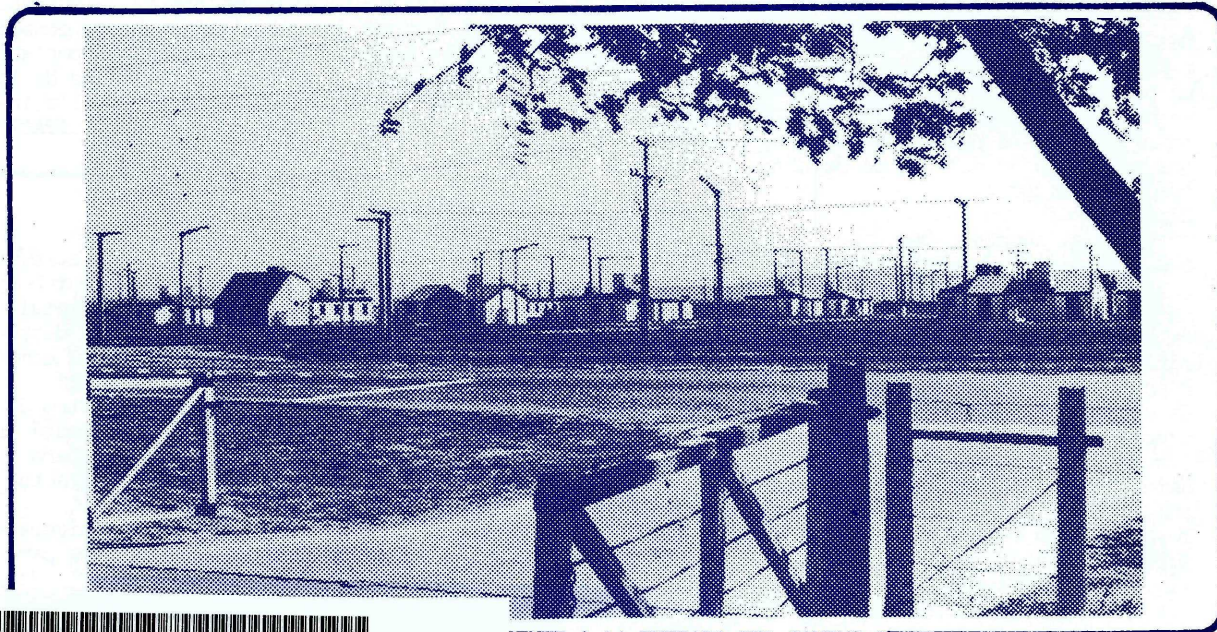
RENTE A LA ENTRADA DEL CAMPUS