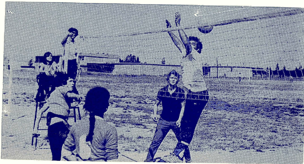
FINAL AMISTOSA ENTRE C. POLITICA Y C. QUIMICAS

*El 31 del corriente se jugarán la final y semifinal de Fútbol.