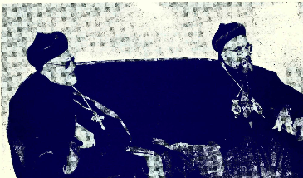
El Patriarca Athanasius Y. Samuel y su Santidad el Patriarca Zakka I

primeros concilios ecuménicos y por otro lado rechazan que exista una cabeza suprema de la Iglesia. No reconocen ni están con el Papa. Se estima que actualmente hay aproximadamente 125 millones de fieles en las distintas iglesias ortodoxas, siendo la griega y la rusa las más importantes. Las relaciones con la Iglesia Católica han mejorado sustancialmente en los últimos años. El Papa Pablo VI se reunió tres veces con el patriarca Atenagoras I, quien tuvo el primado de honor entre sus pares, llegando ambos a anular las excomuniones que sus respectivas iglesias se habían impuesto en 1054.