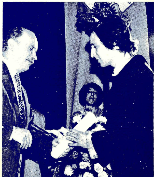
UN EGRESADO RECIBE SU DIPLOMA