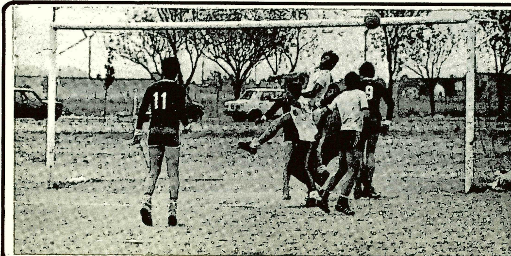
Momento difícil ante el arco de Medicina.