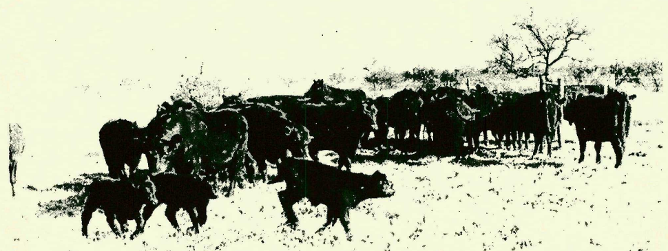
DE ABERDEEN ANGUS EN EL CAMPUS

UNIVERSIDAD CATOLICA DE CORDOBA HEMEROTECA CAMPUS