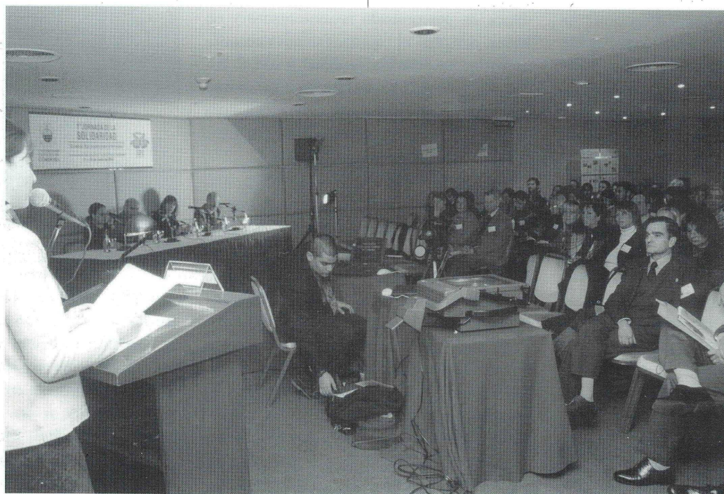
Presentación del VUCC en la apertura de la "1 ra Jornada de la Solidaridad".

Reflexionar y trabajar para propiciar sinceros procesos de promoción humana en el contexto latinoamericano constituye un verdadero desafío. La Universidad Católica de Córdoba unió sus fuerzas a través de autoridades y personal de distintas áreas para hacerlo posible.