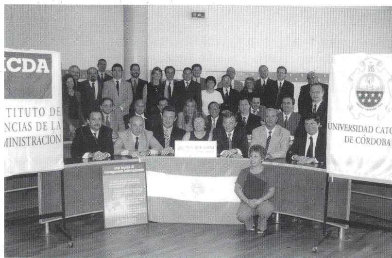
Los participantes del Módulo Internacional en la SDA.

Entre el 9 y el 13 de julio pasado, 32 alumnos del segundo año de la Maestría en Administración de Servicios de Salud participaron del Módulo Internacional dictado en la Scuola de Direzione Aziendale de la Università Luigi Bocconi de la ciudad de Milán (Italia). Cabe destacar que es el segundo grupo que realiza esta experiencia y en ambos casos los resultados alcanzados han sido muy buenos, sobre todo por la calidez y calidad académica de la Università Luigi Bocconi, Institución con la que el ICDA mantiene un proyecto de colaboración desde hace varios años, que incluye la doble titulación de esta Maestría. El Módulo Internacional constituye parte integrante de este Programa y se articula en torno a tareas de tipo académico con visitas a empresas y organizaciones del sector, a fin de tomar contacto con la realidad sanitaria del Continente Europeo.