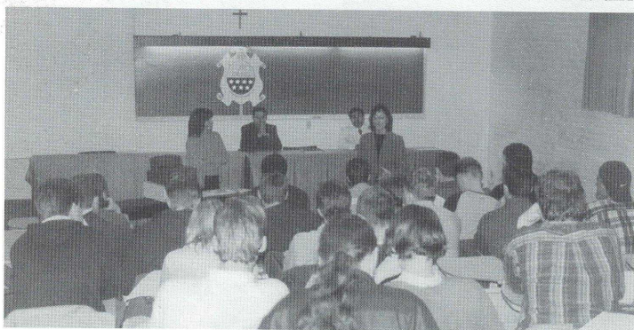
Un momento de las actividades desarrolladas con los estudiantes.

Luego se dirigieron al Laboratorio donde realizaron un práctico de evaluación sensorial en distintas muestras de yerba mate, acompañado por un relato sobre la historia de la misma. Esta actividad estuvo diri-