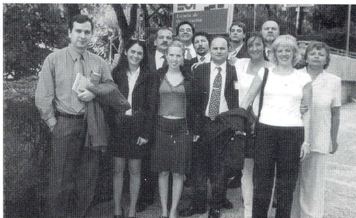
Parte del grupo frente a la EOI en Madrid.

A fines de 1999, el ICDA y la Escuela de Organización Industrial de Madrid acordaron la puesta en marcha de dos programas, Dirección Financiera y Gestión de Logística, a dictarse en el año 2000, en los cuales estaba prevista la realización de un Módulo Internacional, denominado "Semana Tecnológica", en Madrid. Dicho Módulo se llevó a cabo entre el 9 y el 13 de julio pasado, al que asistieron los primeros grupos en finalizar dichos programas, luego de un año de trabajo académico aquí en Córdoba. Las "Semanas Tecnológicas" organizadas por la EOI son una actividad de tipo académico empresarial, y constituyen una buena oportunidad para intercambiar experiencias con estudiantes provenientes de otros países.