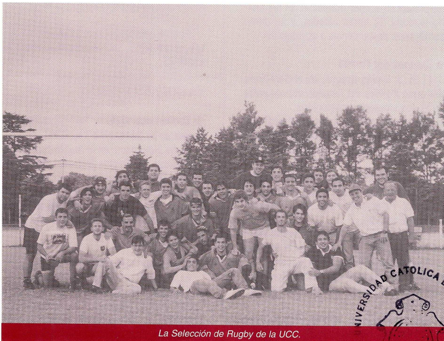
La Selección de Rugby de la UCC.

Se ha conformado la Selección de la UCC, alcanzando excelentes resultados en sus primeros compromisos, ya que ha enfrentado al combinado de San Francisco (obteniendo una importante victoria por 25 a 15), al de Arroyito (la primera caída por 10 a 12) y a Tala interior (nueva victoria por 21 a 17). Los próximos compromisos son con San Francisco (en el Campus) el domingo 12/5 a las 16 hs., con Arroyito (en Arroyito) el día domingo 19/5 y Tala interior (en el Campus) el domingo 26/5 a las 16 hs.