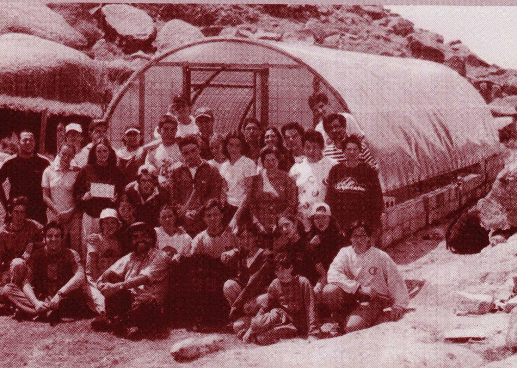
Los integrantes del equipo de trabajo frente al invernadero.