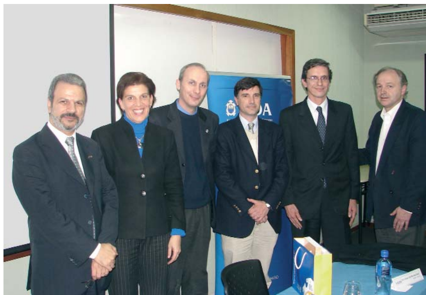
Representantes de la Jornada de Vinculación, Tecnología y Emprendedorismo

con el apoyo del Programa de Incubadoras, Parque y Polos Tecnológicos , de la Dirección Nacional de Proyectos y Programas Especiales (SeCyT).