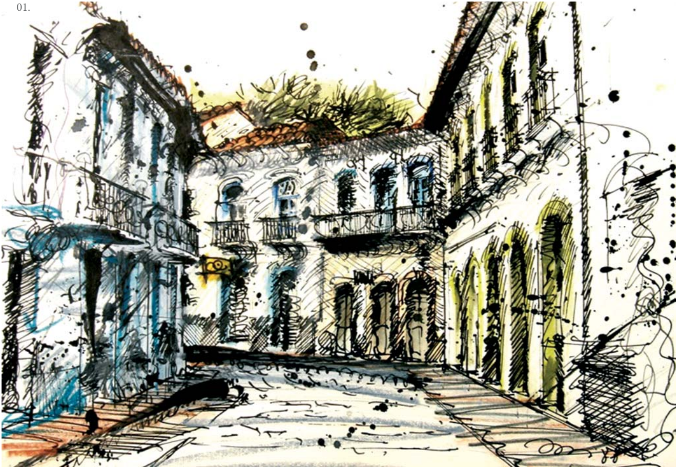
CROQUIS DE VIAJES: 01. Brasil | 02. 03. 04. y 05. Francia