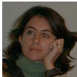
Docente de la Facultad de Derecho y Ciencias Sociales y Docente Investigador en la Facultad de Ciencias Económicas y de Administración

sición implicó un paulatino empobrecimiento de la clase media 1 , acicateado por las privatizaciones, la desregulación y el desmantelamiento del Estado como proveedor de los servicios básicos universales, entre los que se destacan la educación y la salud. La crisis del 2001 sólo vino a cristalizar y presentar el nuevo modelo de país, fruto de la progresiva instalación del neoliberalismo: un país con una brecha entre ricos y pobres que nos ubica entre las naciones más desiguales del planeta. Podríamos dar cifras y estadísticas sobre esta brecha, pero quizás sea más elocuente recurrir a imágenes: en un extremo de la pirámide, los countries o barrios cerrados para los sectores de altos ingresos; y en el otro, las "ciudades para pobres" de la gestión De la Sota. O también, de un lado los ocho muertos que hace un año dejó el incendio del vagón donde vivían trabajadores rurales con sus hijos; y del otro, la acumulación por el boom sojero en la pequeña Villa Valeria. Ambos casos retratan la conformación de una sociedad dual, dos sociedades dentro de una misma sociedad. Mundos separados, que viven y reproducen diferencias insalvables, que construyen sus identidades a miles de años luz unos de otros a pesar de que a veces sólo los separa un cerco, un alambrado.