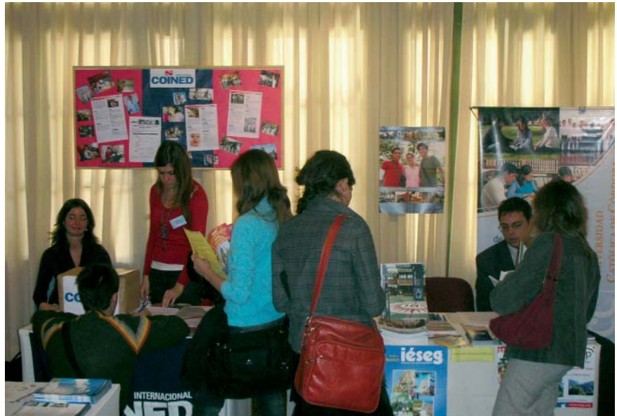
La UCC expuso su oferta académica de intercambio internacional en la Feria.

Más de dos mil personas visitaron, el jueves 17 de abril, la Feria de Cooperación Internacional, en la que, por primera vez en Argentina, instituciones académicas de más de 10 países presentaron ofertas académicas destinadas a alumnos, docentes e investigadores que quieran desarrollar sus estudios de grado o posgrado en el exterior. El evento fue organizado por la Red Córdoba de Cooperación Internacional, de la que participan universidades públicas y privadas de la provincia y el Ministerio de Ciencia y Tecnología de Córdoba.