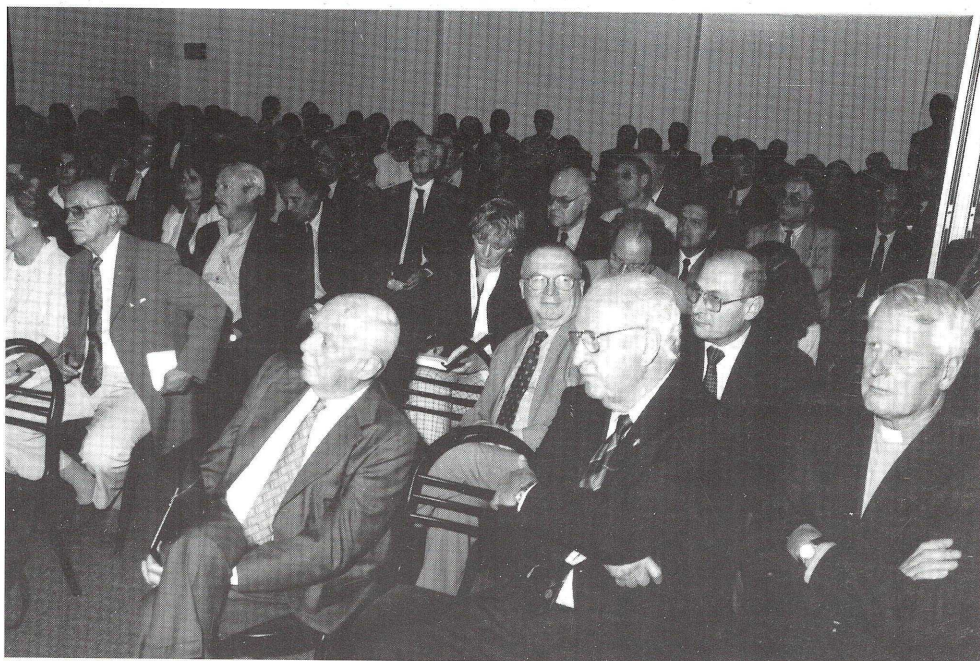
Vista del Auditorio durante el Simposio Universitario.