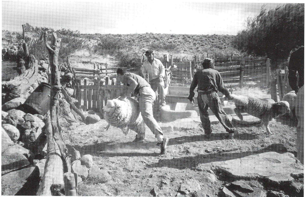
Una escena típica del lugar donde el Grupo Misionero desarrolla sus actividades.