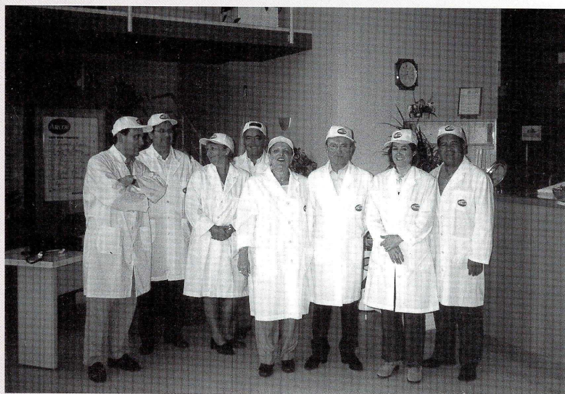
El grupo de Decanos, en su visita a la planta de la empresa ARCOR en Arroyito (Provincia de Córdoba).

El tema abordado en estas jornadas fue la "Evaluación de la Calidad de las Titulaciones en Ciencias y/o Tecnologías de los Alimentos". Para ello se estudiaron y compatibilizaron currículas de las diferentes asignaturas que permitirán realizar programas de intercambio de estudiantes y docentes, además de pasantías en diferentes empresas de los países mencionados. Para materializar estos objetivos se han formalizado los convenios correspondientes.