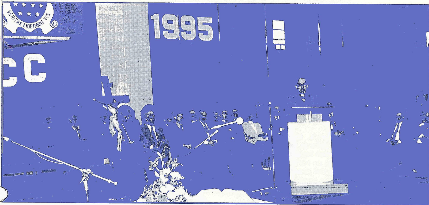
Vista panorámica de la Colación de Grados

Lo novedoso de este acto fue que todos los graduados llevaban encima de sus togas las cintas de colores distintivos de la U.C.C. y de su propia Facultad. (ver nota aparte)