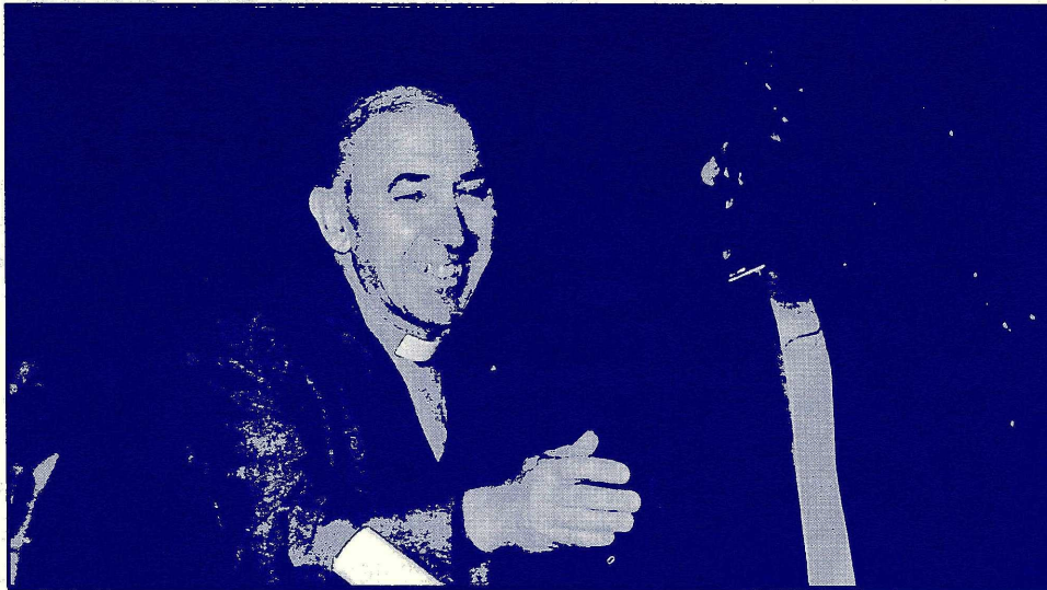
El P. Rector entrega un premio Universidad

el de esta mañana pues los ritos de iniciación poseen la particularidad de desatar una carrera inevitablemente desacompasada entre lo que se ha llegado a ser y lo que aún se quiere ser. Uno no es sólo lo que es. "Yo soy lo que soy más lo que quiero ser".