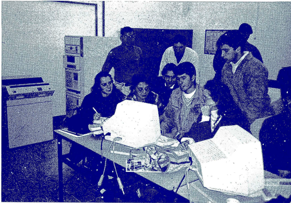
Estudiantes trabajando con tecnología de punta.

Las gestiones comenzaron en Octubre de 1992, y a fines de 1993 se concretó un convenio de cooperación por cinco años, firmado por IBM y la UCC.