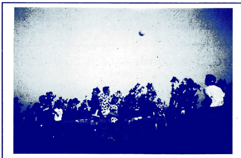
"Mecánica III" despeja el camino hacia un triunfo sobre "Juventus"

El campeonato Apertura de fútbol estuvo al sábado pasado al rojo vivo. El equipo Administración "Los Gerentes" se consagró campeón de la categoría "B-C", lo que le permitió el ascenso a la categoría "A" junto con "Contadores con Coca que fue subcampeón.