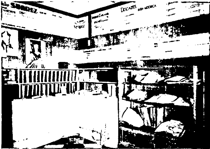
El Stand del s. XVII: 1ª sección.