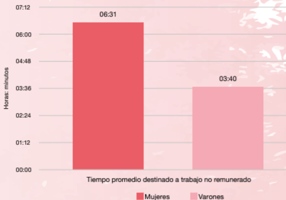
Gráfico 3.9 Tiempo por participante (con simultaneidad) en el trabajo no remunerado de la población de 14 años y más, por sexo. Año 2021